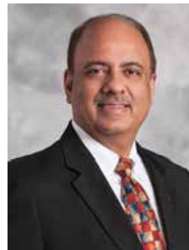
Shekhar Mehta President, Rotary International 2021-22