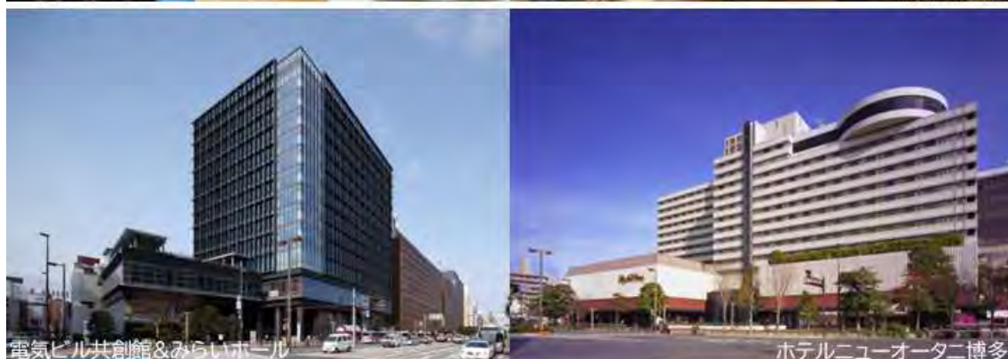
電気ビル共創館&みらいホール