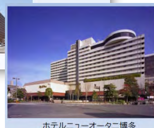
ホテルニューオータニ博多